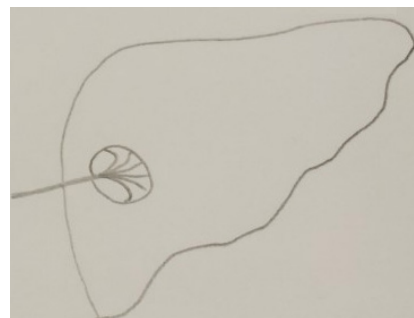
Les antennes sont déployées